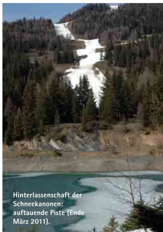
Hinterlassenschaft der Schneekanonen: auftauende Piste (Ende März 2011).

Was ist das eigentlich, die Walliser Küche? Trockenfleisch und das kompakte, schwere Roggenbrot sind bekannt. Und eben der Käse. Dazu passen die vielfältigen Weine aus raren Sorten. Ich suchte in Montana nach dem gastronomischen Wallis, fragte im Informationszentrum nach, wo man denn hier in typischer Walliser Manier tafeln könne und wurde auf Häuser hingewiesen, die zwar im traditionellen alpinen Stil gebaut sind, aber doch eine internationale Speisekar- ▶