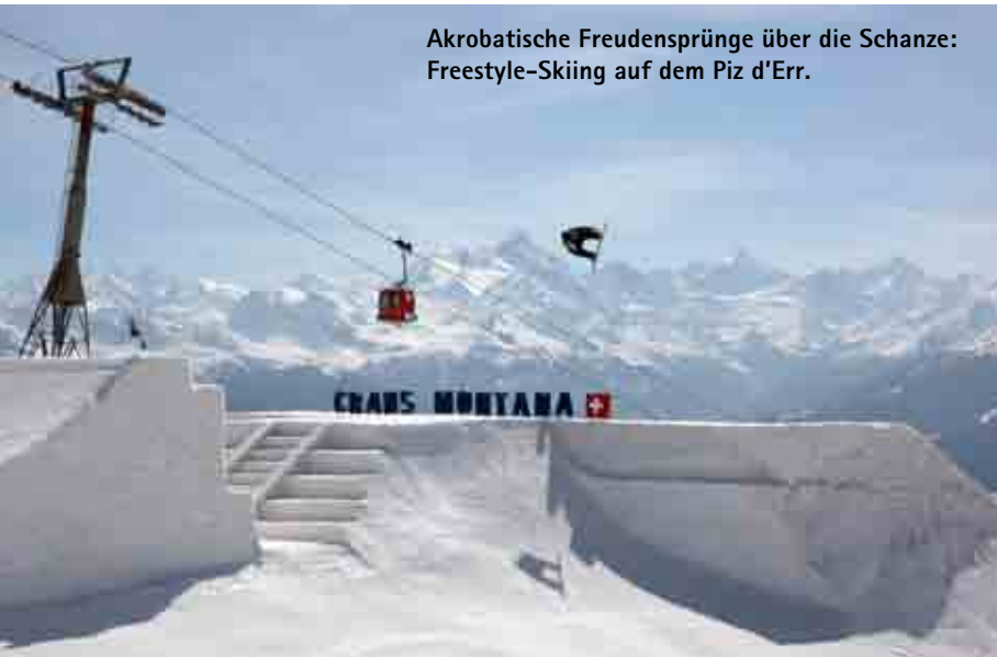
Akrobatische Freudensprünge über die Schanze: Freestyle-Skiing auf dem Piz d'Err.