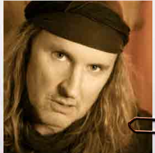
Chris von Rohr