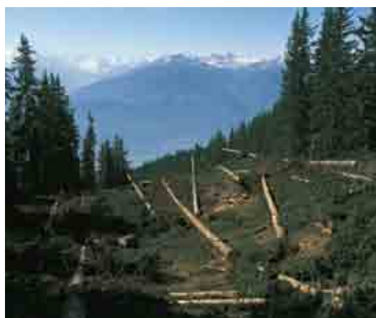
Platz für den Ski-Zirkus: Waldrodung im Juni 1986 für die Piste in Weiss.