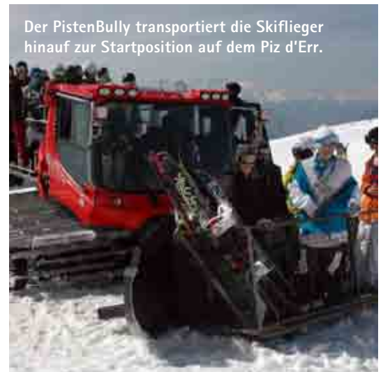
Der PistenBully transportiert die Skiflieger hinauf zur Startposition auf dem Piz d'Err.

Neben dem Speiserestaurant im Hotel «LeCrans» gehört der Bärentritt zu den beiden besten Häusern am Ort. Im «LeCrans», wo wir unsere Unterkunft hatten, fiel uns die grosszügige Art auf. Auch hier setzte das Abendessen Massstäbe: vom Doraden-Tatar (Goldbrasse) mit Zitronenmousse bis zum Lammcarrée mit Mini-Ravioli und Morcheln. Als wir uns mit dem Auswählen der Nachspeise abmühten, sammelte der Kellner die Karten ein und sagte, er bringe uns gleich vier verschiedene Teller. Darunter waren drei aufwendige, fulminante Neukreationen, gastronomische Kunstwerke, eines mit einer scheren-schnittartig durchbrochenen Roulade aus weisser Schokolade umfasst. Darin war eine Blätterteigrolle, aus der Früchte und Fruchtsaucen herausquollen. Süsse Träume vor der alpinen Kulisse. ■