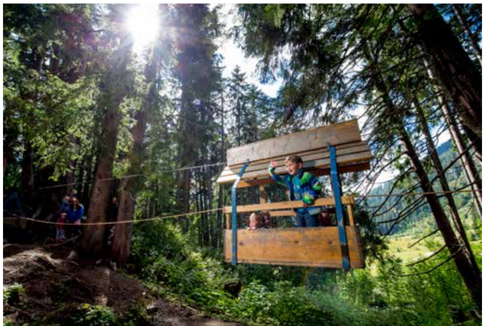
Bild oben: Wer nicht Ski fahren will, genießt auf dem Hasliberg kilometerlangen Schlittelspass – auch nachts. Bild unten: Auch in der Sommersaison kommen Kinder ganz auf ihre Kosten: Die Zwergenwege ermöglichen Abenteuer mit dem ältesten Haslizwerg Muggestutz.