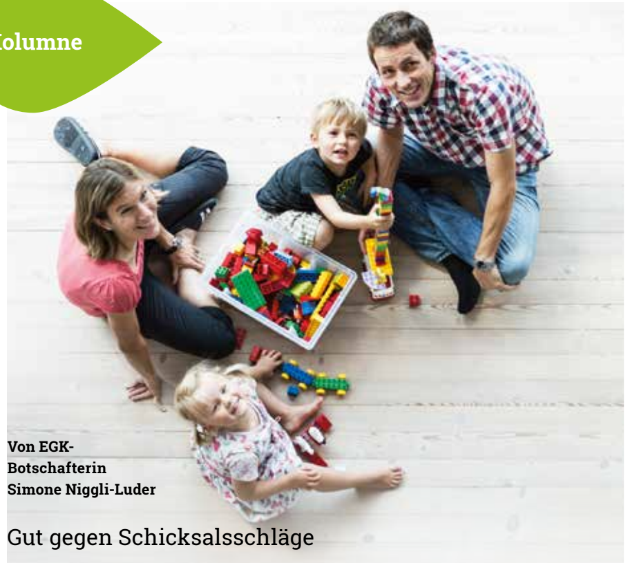
Von EGK- Botschafterin Simone Niggli-Luder