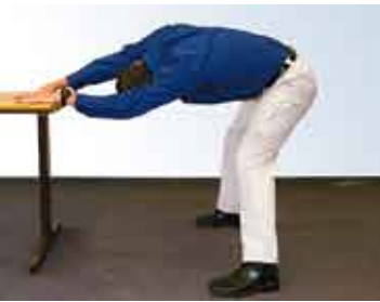
Teure Fitnessgeräte sind nicht nötig – für die Rückendehnung genügt der Schreibtisch.