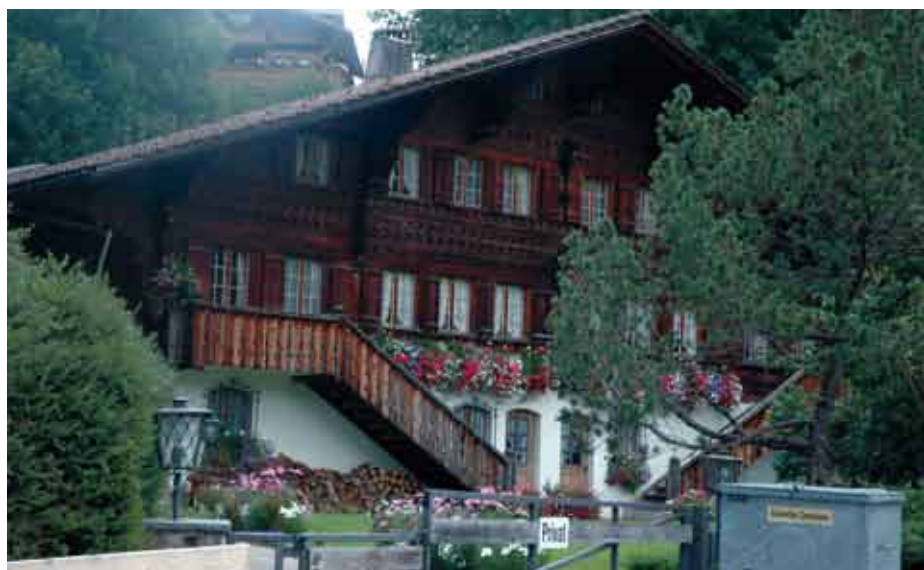
Wo einst Prinz Saddruin Aga Khan wohnte: Typisches Châlet in Gstaad

Offensichtlich gefällt es den Pflanzen hier ausgezeichnet, sogar dem Steppenbeifuss (Präriebei-