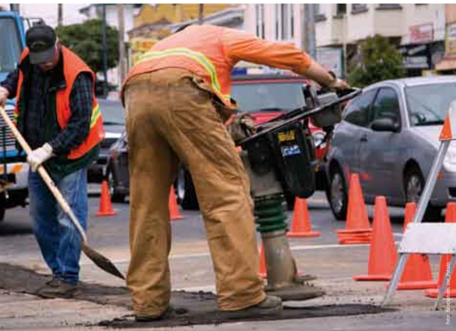
Gezielte Übungen für körperlich schwer Arbeitende beugen Fehlbelastungen vor.

Andere Prioritäten haben die Entlastungs- und Kräftigungsübungen für Menschen, die körperlich harte Arbeit verrichten, wie Wald- und Bauarbeiter, Handwerker, Lageristen und Bauern. Bei ihnen geht es in erster Linie darum, die häufig beanspruchten Muskeln richtig zu trainieren und Fehlhaltungen zu vermeiden. Müssen schwere