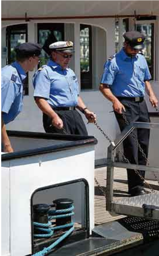
Koordinierte Teamarbeit ist im Schifffahrtsbetrieb unerlässlich.