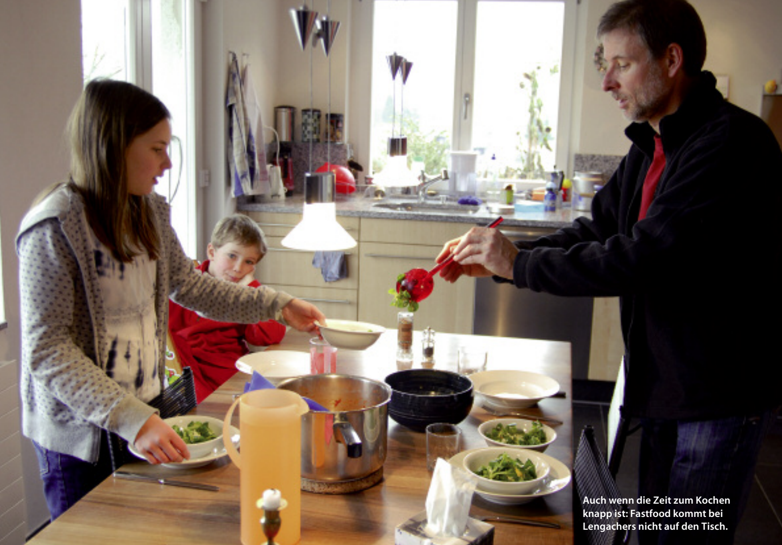
Auch wenn die Zeit zum Kochen knapp ist: Fastfood kommt bei Lengachers nicht auf den Tisch.

ser verdienenden Mann fördern den Umstieg ebenfalls nicht. «Es ist bitter, wenn die 50 Prozentstelle der Frau nur halb soviel einbringt wie die des Mannes. Da überlegt es sich ein Paar zweimal, ob sie diese Einkommenseinbusse auf sich nehmen will.»