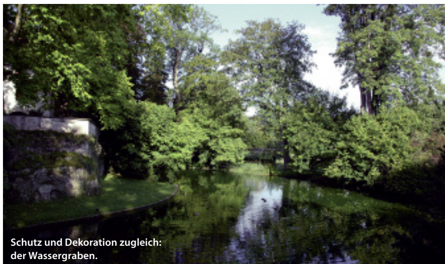
Schutz und Dekoration zugleich: der Wassergraben.

Denkmalpflege des Kantons Bern Münstergasse 32, 3011 Bern