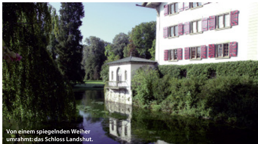
Von einem spiegelnden Weiher umrahmt: das Schloss Landshut.

In seiner heutigen Erscheinungsweise ist das Schloss ein Bauwerk aus dem 17. Jahrhundert, das auf viel älteren Grundmauern steht und sein jetziges Aussehen erst nach 1798 (Proklamation der Helvetischen Republik) erhielt. Der Berner Staatsmann und General Niklaus Rudolf von Wattenwyl erwarb das Gebäude zu seinem privaten ▶