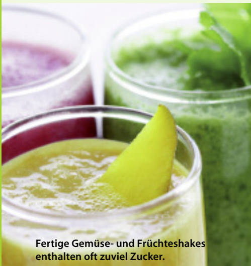
Fertige Gemüse- und Fruchteshakes enthalten oft zuviel Zucker.

Immer mehr Konsumenten nehmen sich nicht mehr die Zeit, ihre Äpfel und Karotten selbst zu schälen. Sie greifen lieber zum Obst- und Gemüsemix aus der Flasche, der häufig Fruchtmarmelade, Saftkonzentrat und Gemüsepüree enthält. Die Stiftung Warentest rät aber dazu, deren Zusammensetzung vor dem Kauf genau zu überprüfen. Die durch den hohen Fruchtzuckeranteil ohnehin schon süßen Produkte sollten keinen weiteren Zuckerzusatz enthalten. Ausserdem gehen bei der Herstellung des Pürees fast immer die zum Teil wertvollen sekundären Pflanzenstoffe und Ballaststoffe verloren, da oft Schale und Kerne entfernt werden. Auch muss der süsse Shake nicht gekaut werden. Dadurch ist der Magen weniger gefüllt als beim Verzehr von frischen Früchten und Gemüse. Shakes verringern das Geschmackserlebnis und das Sättigungsgefühl. Empfohlen wird ein gut zusammengesetzter Shake ohne Zuckerzusatz, wenn keine feste Nahrung oder Frischkost gegessen werden darf, wie es bei bestimmten Krankheiten oder bettlägerigen Menschen der Fall ist.