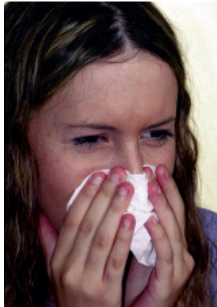
Bei Erkältungen nicht zu oft die Nase putzen.