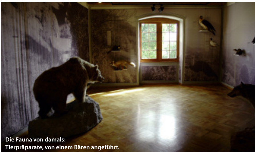
Die Fauna von damals: Tierpräparate, von einem Bären angeführt.

Die Zimmerleute wählten Eichen und Nussbäume im Winter in Wäldern der Umgebung persönlich sorgfältig aus, liessen die Stämme im Frühjahr, wenn die Emme genügend Wasser führte, zur Baustelle flössen und verarbeiteten das Holz «grün», also nicht im getrockneten, sondern im nassen Zustand, ohne dass irgendwelche Schäden auftraten. Sie sägten es, fertigten Holznägel an und bauten daraus unter anderem den liegenden Dachstuhl, der ohne senkrechte Balken auskommt. Andreaskreuze verbinden die Balken und verhindern das Wackeln des Hauses. Die Holzkonstruktion ist also für den Zusammenhalt des Schlossgebäudes verantwortlich. Auf dem Dachstuhl sind Dachlatten angebracht, die das Schindeldach tragen. Darauf ruhen eine weitere Latung und die Biberschwanzziegel. Ein Tonplattenboden auf einer Mörtelschicht dient als Brandschutz, was wichtig war, da früher täglich gefeuert wurde. Vom Sinn für Funktionalität und Schönheit, verbunden mit einem phänomenalen Können der Hand-