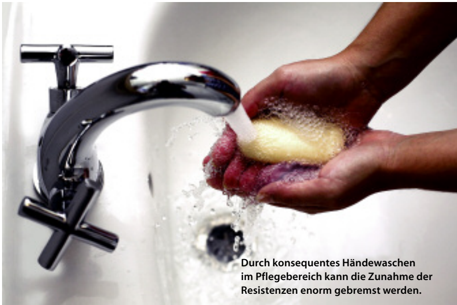
Durch konsequentes Händewaschen im Pflegebereich kann die Zunahme der Resistenzen enorm gebremst werden.

was von ihrem Geheimnis verraten und uns beistehen. Ausserdem schwören viele Naturärzte auch im Desinfektionsbereich auf die immense Kraft der ätherischen Öle, bei denen es noch Einiges zu erforschen gibt.