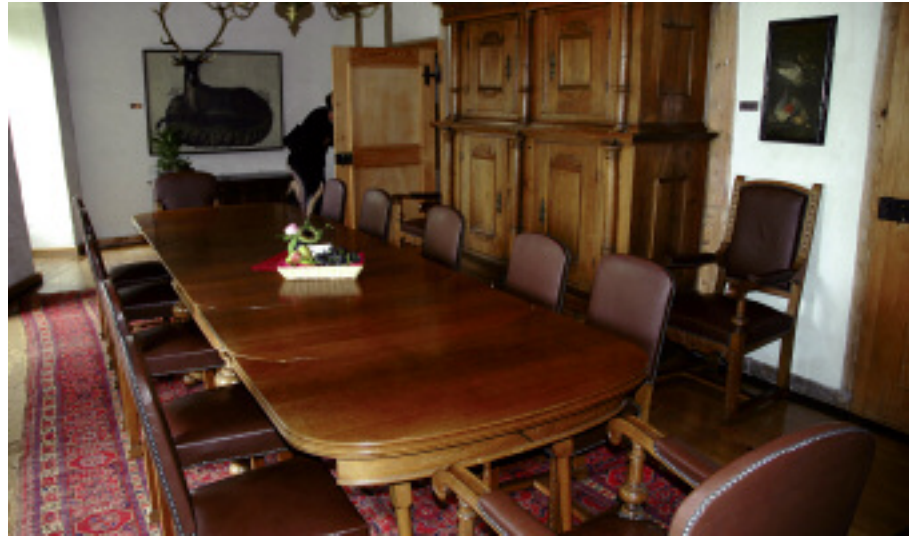
Währschafte Handwerkskunst, dem Holz zugewandt: Wohnraum mit Anklängen an die Jagd.

Gebrauch. Es wurde nachher baulich immer wieder verändert, und der Bau spiegelt die Geschichte der Nutzung als Festung, Landvogteischloss und privater Landsitz. So finden sich im Festsaal die Wappen der Landvögte, das virtuos geschnitzte Prunkbuffet (1628 von Tischmacher Hans Glock geschaffen) und das prächtige Renaissancetäfer.