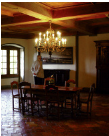
Geräumig und nobel: der Festsaal.

werker, bin ich immer tief beeindruckt. Das waren Künstler im wahren Sinn des Worts; es gibt noch heute einige davon, und man sollte sie mit Aufträgen beehren.