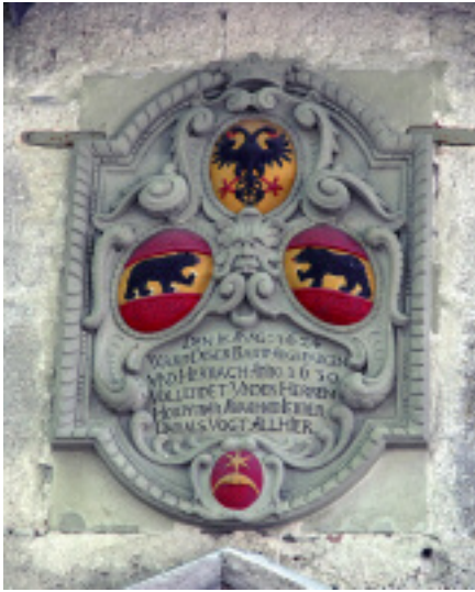
Barockrelief mit dem Bern-Reich-Wappen von 1666.